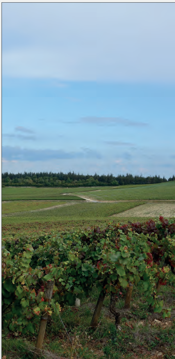
Vins rouges sauf mention contraire